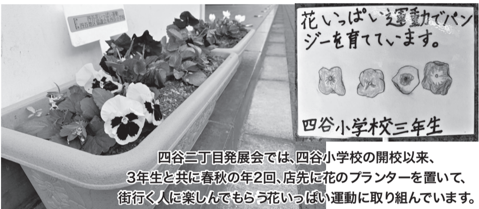
四谷三丁目発展会では、四谷小学校の開校以来、 3年生と共に春秋の年2回、店先に花のプランターを置いて、 街行く人に楽しんでもらう花いっぱい運動に取り組んでいます。

終わりに皆様がたに おかれましては一層健 康に留意され本年がよ り良い一年になるよう 祈念し、一刻も早く新 型コロナが終息される ことを願いつつ新年の ご挨拶とさせていただきます。